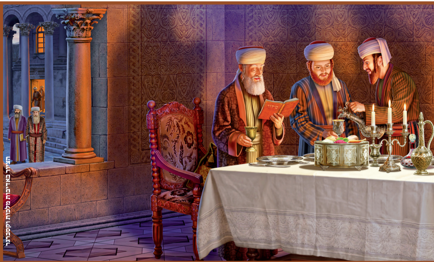
"שהיו מסובין בבני ברק" לתקן בני בניו של המן "שלמדו תורה בבני ברק"

מעתה אומר ה"חתם סופר", כי החכמים הללו "שהיו מסובין בבני ברק", והיו מספרים ביציאת מצרים כל אותו הלילה, ביקשו לתקן בכך את בני בניו של המן שלמדו תורה "בבני ברק", אשר אבי אבותיהם המן הרשע גרם לבטל מצות סיפור יציאת מצרים. והנה מפלת המן התחילה בבוקר כשבא למלך לתלות את מרדכי ובסופו של דבר נתלה הוא עצמו, וזהו הענין שבאו תלמידיהם ואמרו: "רבותינו הגיע